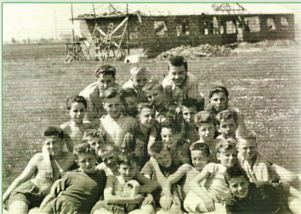
Rozestavěné šatny – žáci ročníku 1944 -1945