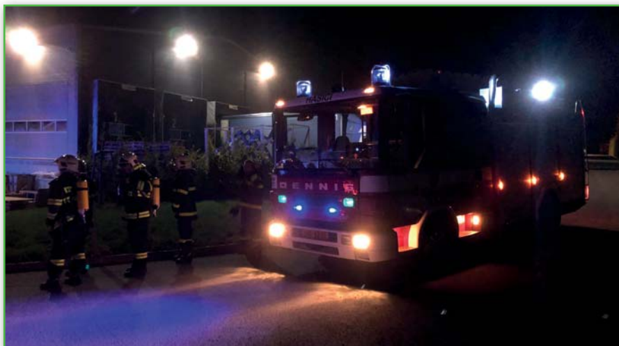
Požár v Bílovicích