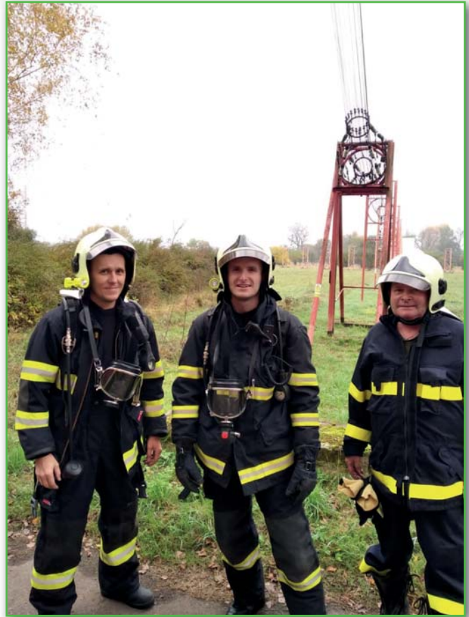
Planý poplach v areálu Vysílaček