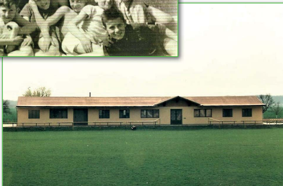
Šatny po povodni 1997