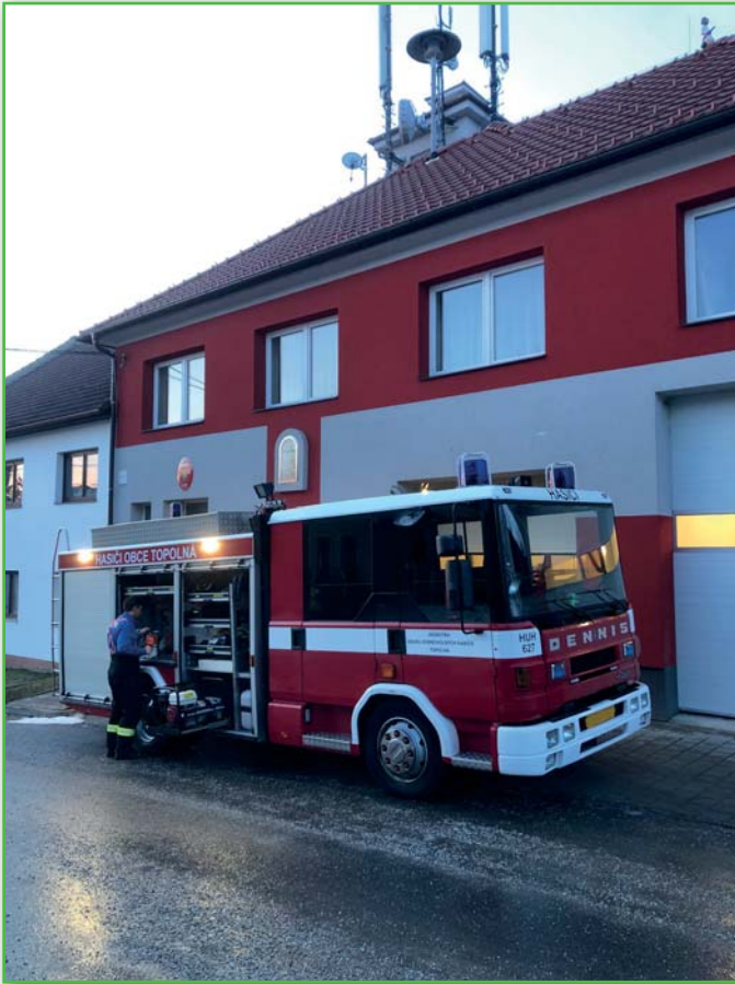
Kontrola techniky a vybavení