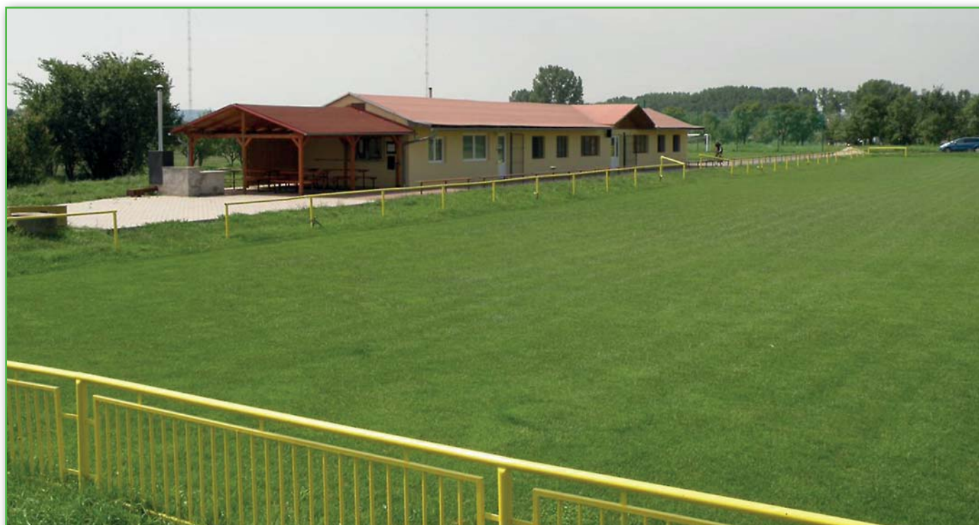
Šatny po roce 2010