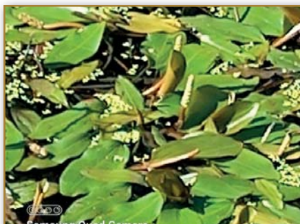
Rdest uzlinatý (ohrožený druh C3) nalezen v nové tůňce pod vinohrady