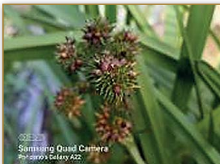
Zevar vzpřímený vejcoplodý 4a) ohrožený druh nalezen u nové tůňky v remíze