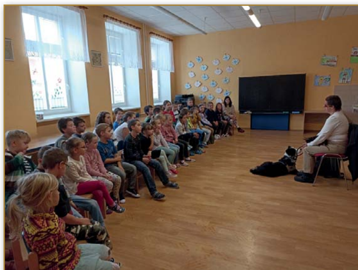
Úžasná pozornost dětí při besedě