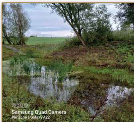
Tůňka pod vinohrady