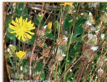
Škarda štětinkatá (kriticky ohrožený druh C1t) nalezena v novém odvodňovacím příkopu