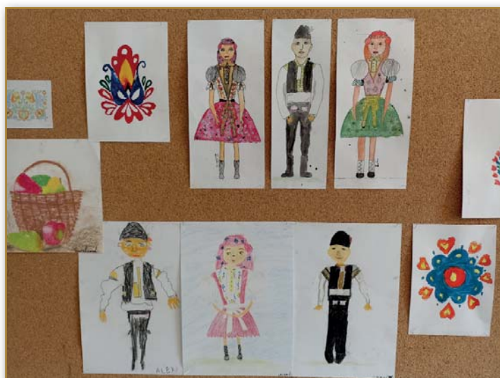
Či sú hody.....děti ZŠ