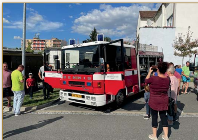
Oslavy založení SDH Napajedla