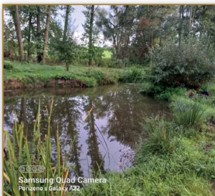
Tůňka v remíze