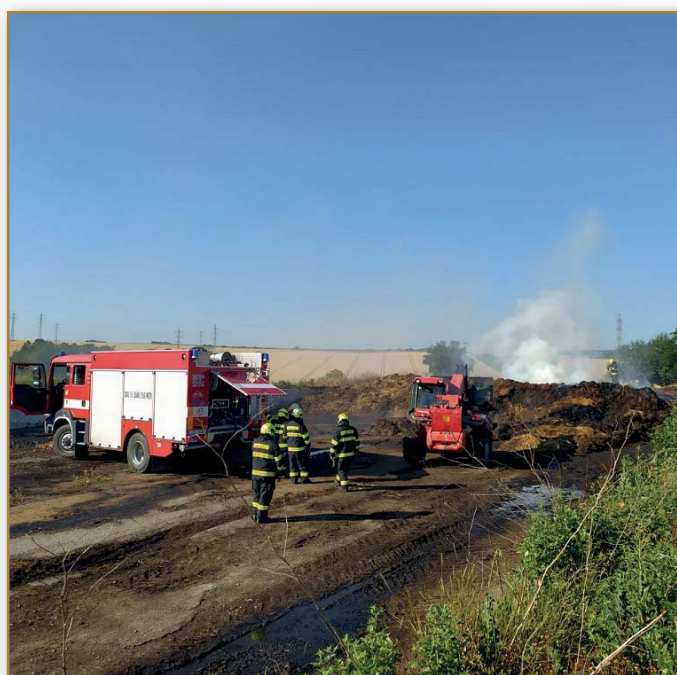
Požár v obci Topolná