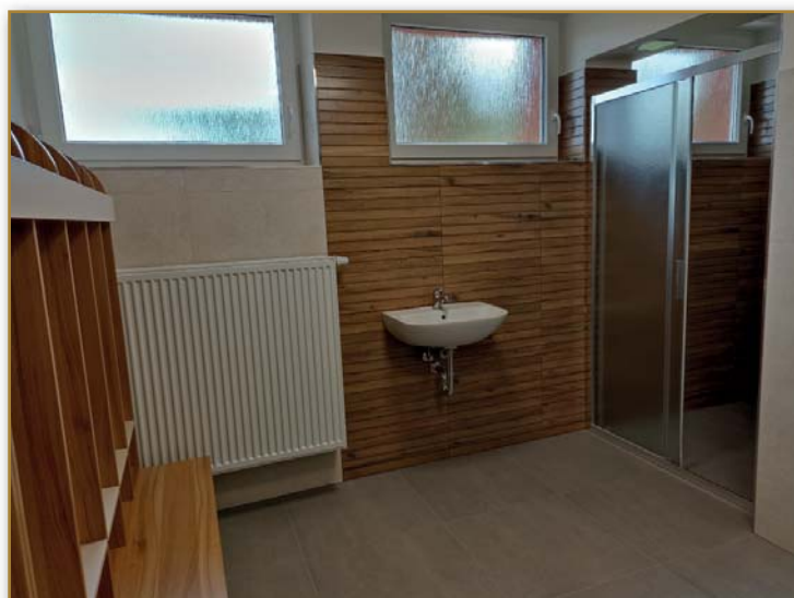
Nové šatny se sprchovým koutem