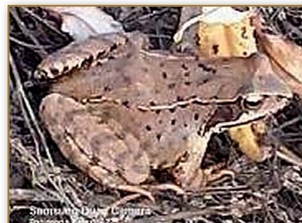
Skokan štíhlý (ohrožený druh) zdokumentován u nové tůňky v remíze