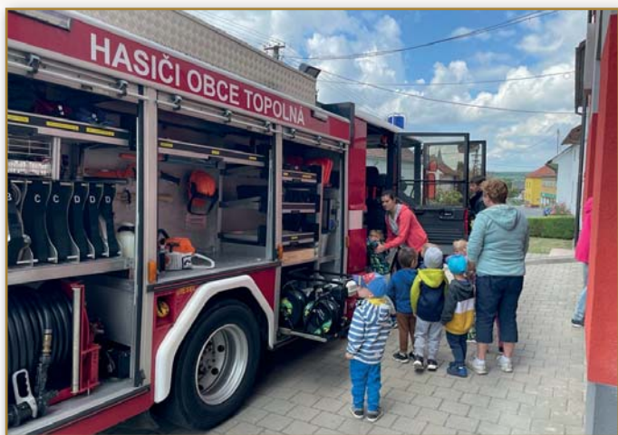
Mateřská škola u hasičů