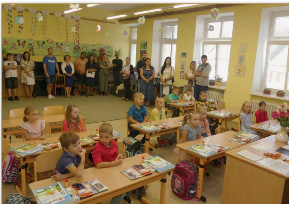
První školní den pro prvňáčky