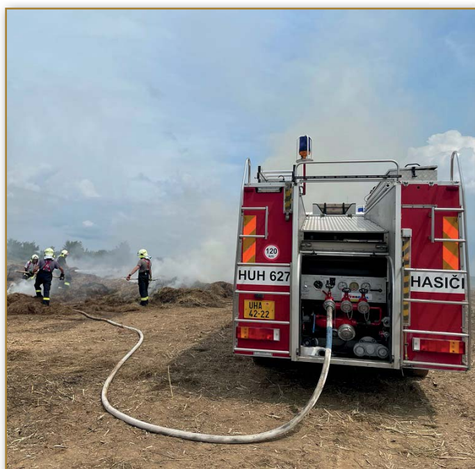
Požár v obci Oldřichovice