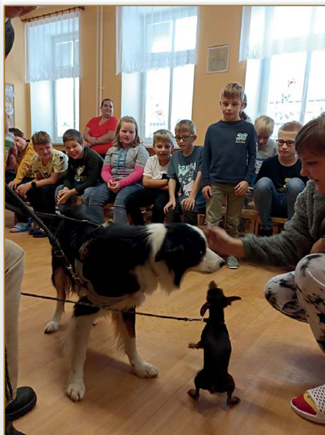
Program – Nehlad' toho psa