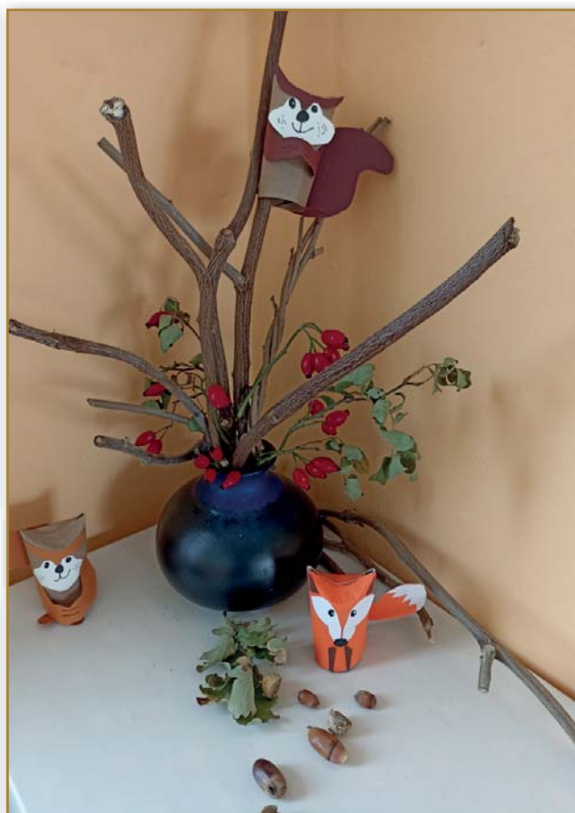
Podzim ve škole