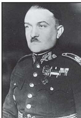
Generál Alois Eliáš

To je jen útržek ze svědectví, které bylo podáno. O dalších událostech