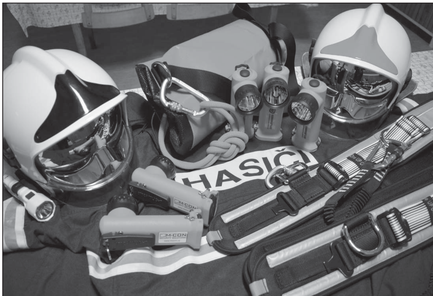
Sponzorský dar od M-CON