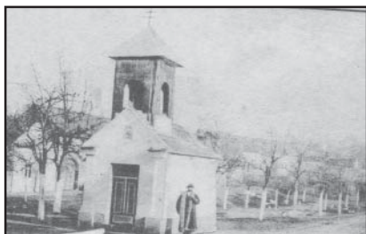
Aleje stromů na návsi

V roce 1808 je v kronice bílovecké farnosti seznam církevních památek v jednotlivých obcích. V Topolné je uvedena kaplička s obrazem Nejsvětější Trojice a kamenný sloup – boží muka.