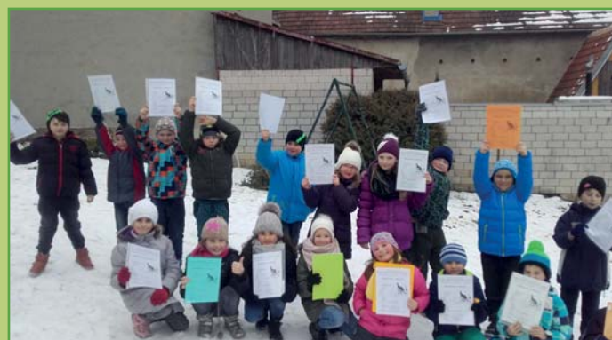
Předávání pololetního vysvědčení žákům 2. třídy