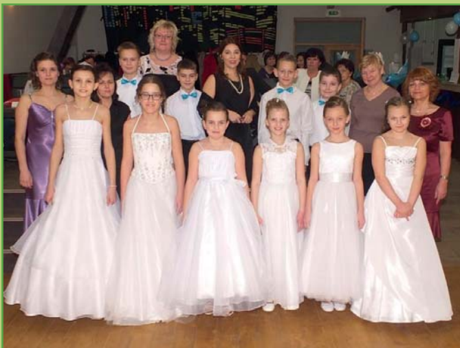
Polonéza žáků 5. třídy