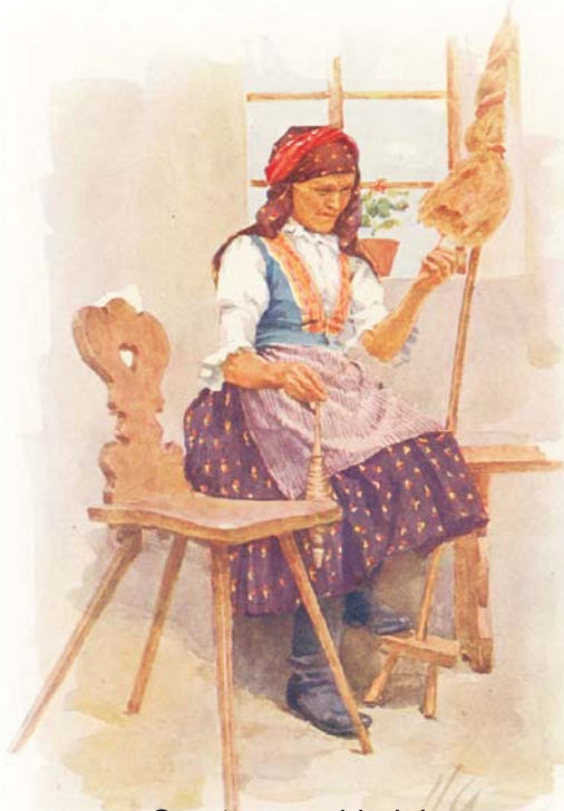
O autorce pohlednice M. Gardavské na str.4